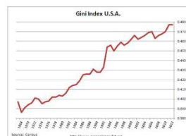
Gráfico 2 - Histórico do Coeficiente de Gini dos EUA.